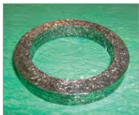
アルミ箔成型パッキン