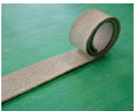
マンホールパッキン