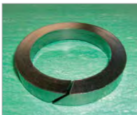
膨張黒鉛成型パッキン