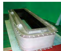
短缶フレアタイプ